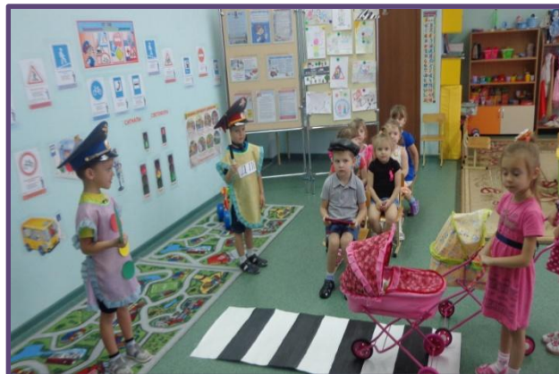
Сюжетно-ролевая игра «Регулировщик»