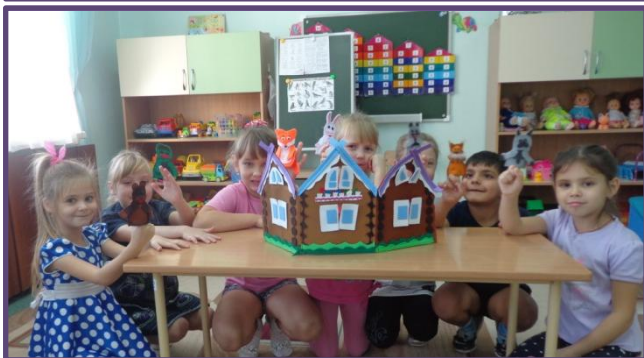
Пальчиковые игры «Рукавичка», «Теремок»