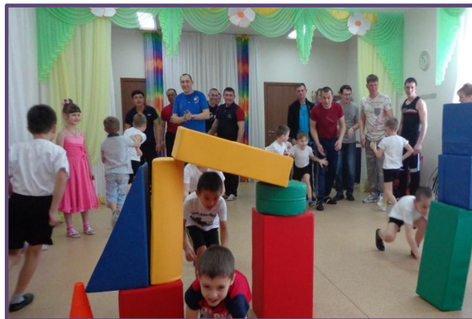
Спортивные развлечения «Весёлые старты»