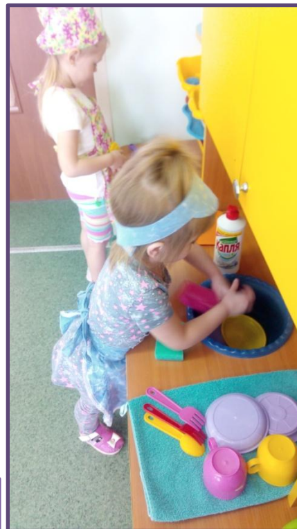
Сюжетно-ролевые игры «На кухне», «Больница»