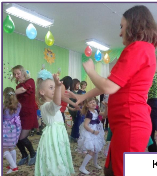
Конкурсно-игровая программа «Дочки мамы»