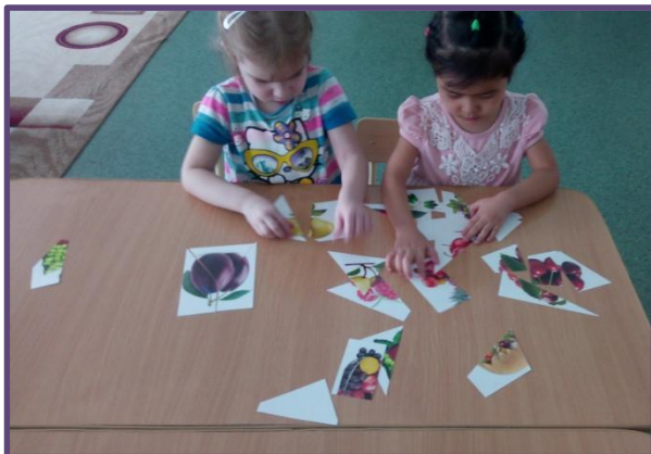
Дидактическая игра «Собери картинку»