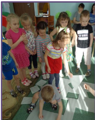
Открытые занятия для просмотра родителей