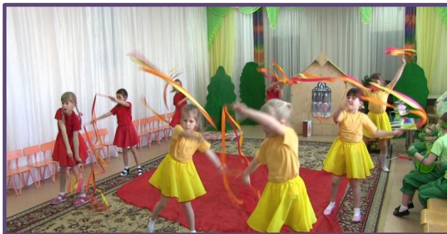
Театрализованное представление «Пожар в лесу»